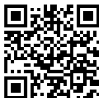
Настанова щодо встановлення та налаштування